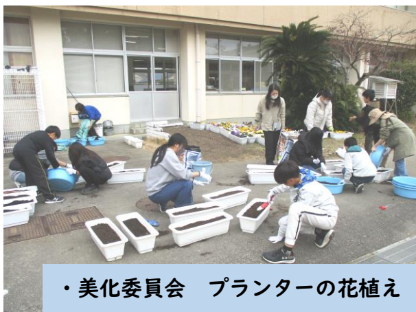
・美化委員会 プランターの花植え