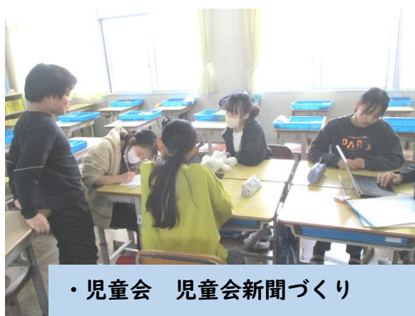
・児童会 児童会新聞づくり